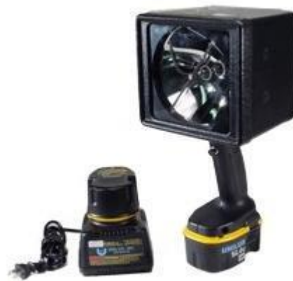
Estroboscópio com acumulador Beacon

O estroboscópio com acumulador oferece um alto rendimento sobretudo na inspeção e na produção de empresas fabricantes de laminação plana, como aço, papel, têxtil... Torne visíveis coisas da sua produção que de outro modo nunca descobriria.